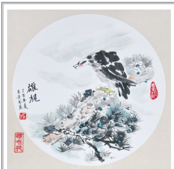
雄视(国画) 朱景龙 作

奋斗是幸福的。因为只有奋斗者才能创造无愧于历史的辉煌业绩,书写无悔的人生、幸福的人生。